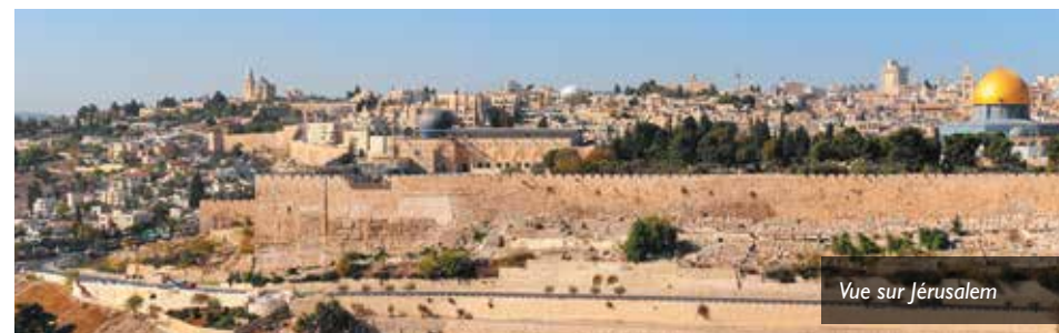
Vue sur Jérusalem