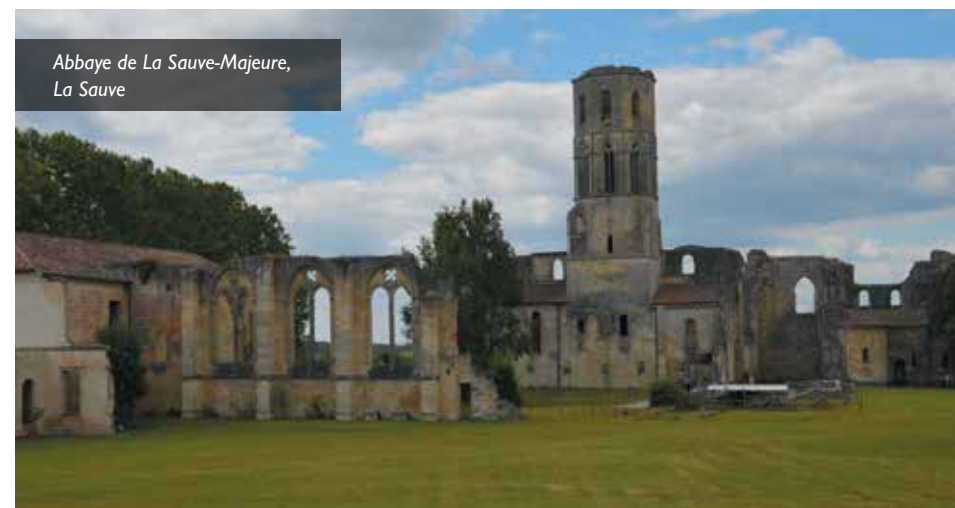
Abbaye de La Sauve-Majeure, La Sauve

À partir de la théologie de la glorification de l'homme chez saint Irénée, nous rechercherons comment la vie ecclésiale nourrit chez les baptisés l'espérance de leur accès à la vie divine.