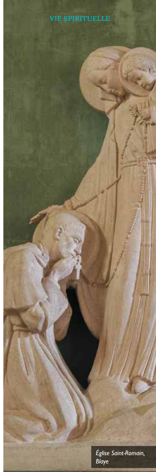
Église Saint-Romain, Blaye

65€ (prise en charge possible des paroisses)