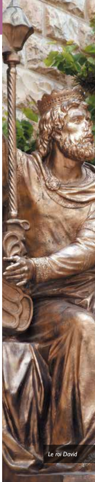
Le roi David

La session propose une introduction au Psautier dans une approche d'abord synchronique, puis diachronique. Trois psaumes seront ensuite étudiés plus à fond, tirés des 3 e , 4 e et 5 e livres : les Psaumes 74, 93 et 146 (numérotation de la bible hébraïque). Cette étude sera l'occasion de se familiariser avec deux méthodes exégétiques qui ont trouvé un champ d'application dans le Psautier, et d'en approfondir les principes : la critique des genres littéraires (les psaumes individuels replacés dans un hypothétique milieu natif) et la critique de la rédaction (recherche de la logique ayant présidé à la composition de l'ensemble du livre).