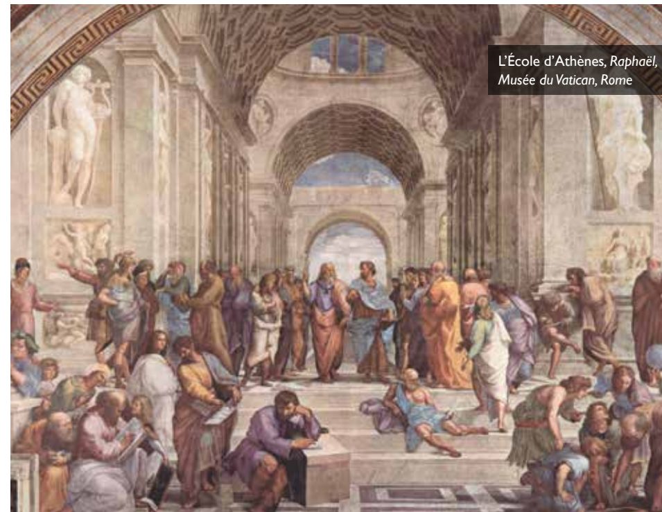
L'École d'Athènes, Raphaël, Musée du Vatican, Rome