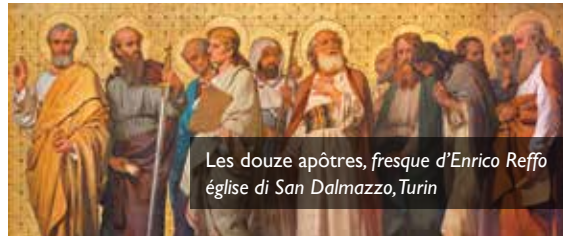
Les douze apôtres, fresque d'Enrico Reffo église di San Dalmazzo, Turin