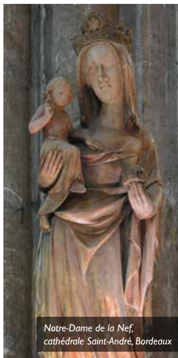
Notre-Dame de la Nef, cathédrale Saint-André, Bordeaux