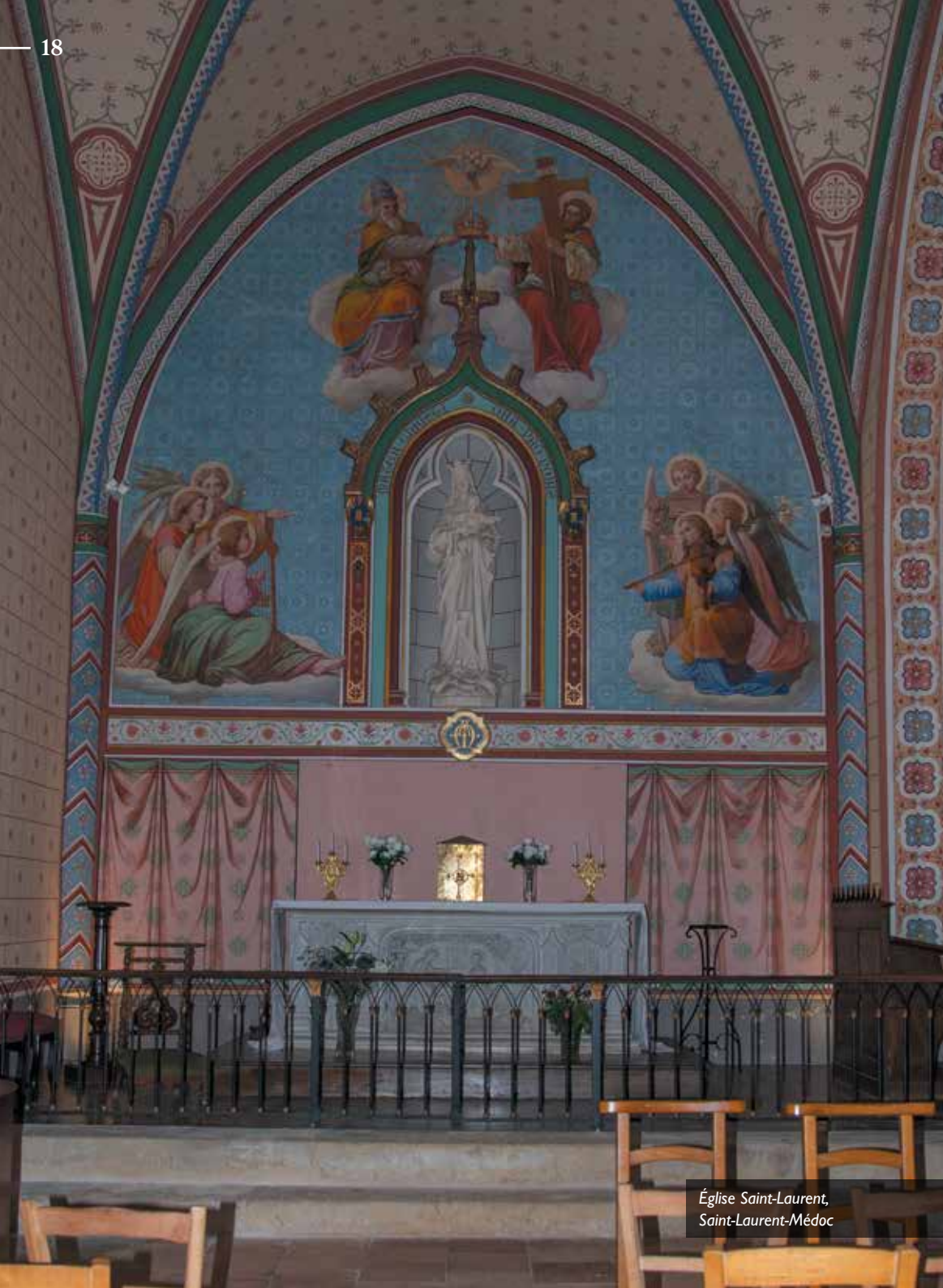
Église Saint-Laurent, Saint-Laurent-Médoc